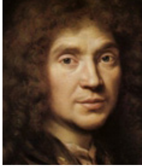
Jean-Baptiste Poquelin dit Molière

Auteur dramatique et comédien français (Paris 1622 - id. 1673). (...) Il suivit de solides études chez les jésuites du collège de Clermont puis se prépara à devenir avocat. La rencontre de Tiberio Fiorelli, dit Scaramouche, et celle de Madeleine Béjart le déterminèrent à renoncer à cette carrière pour le théâtre. Avec Madeleine Béjart, ses frères Joseph et Louis et neuf autres comédiens, il signa l'acte de fondation de l' Illustre-Théâtre (1643). Les débuts de la compagnie furent désastreux et Jean-Baptiste Poquelin, devenu Molière, fut incarcéré au Châtelet (1645). (...)